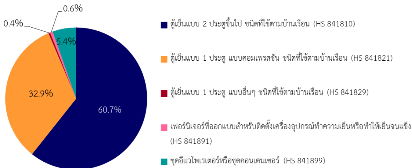
ภาพที่ 2 สัดส่วนการส่งออกสินค้าตู้เย็นและส่วนประกอบของไทย รายพิกัด ปี 2020